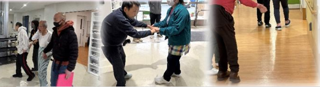
職員出勤率に応じた業務